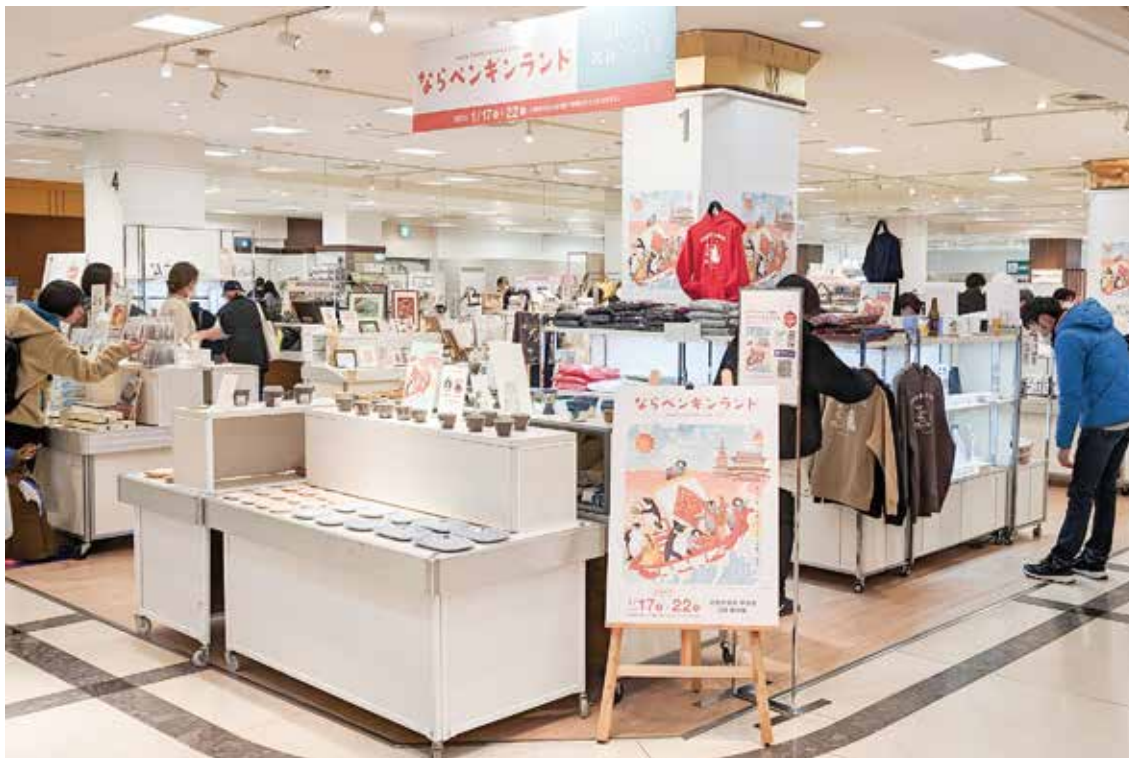
※画像：ならペンギンランド(2024年1月 近鉄百貨店奈良店)